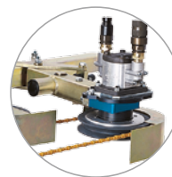
Motor de accionamiento hidráulico estándar