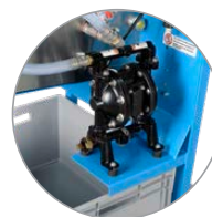
Bomba de vacío

La prensa de filtrado de lodo SPP400 se ha desarrollado especialmente para obras pequeñas y es, debido a su diseño compacto, la prensa de filtrado más móvil y fácil de usar del mercado. Gracias a su bajo peso, a la tecnología de aire patentada y