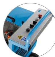
Panel de mando claro