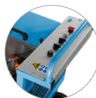
Panel de mando claro