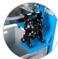
Bomba de vacío

La prensa de filtrado de lodo SPP400*** se ha desarrollado especialmente para obras pequeñas y es, debido a su diseño compacto, la prensa de filtrado más móvil y fácil de usar del mercado. Gracias a su bajo peso, a la tecnología de aire