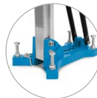
Base con tacos compacta