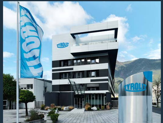
La sede de la empresa TYROLIT en Schwaz, Austria.

Like us on Facebook facebook.com/TYROLIT